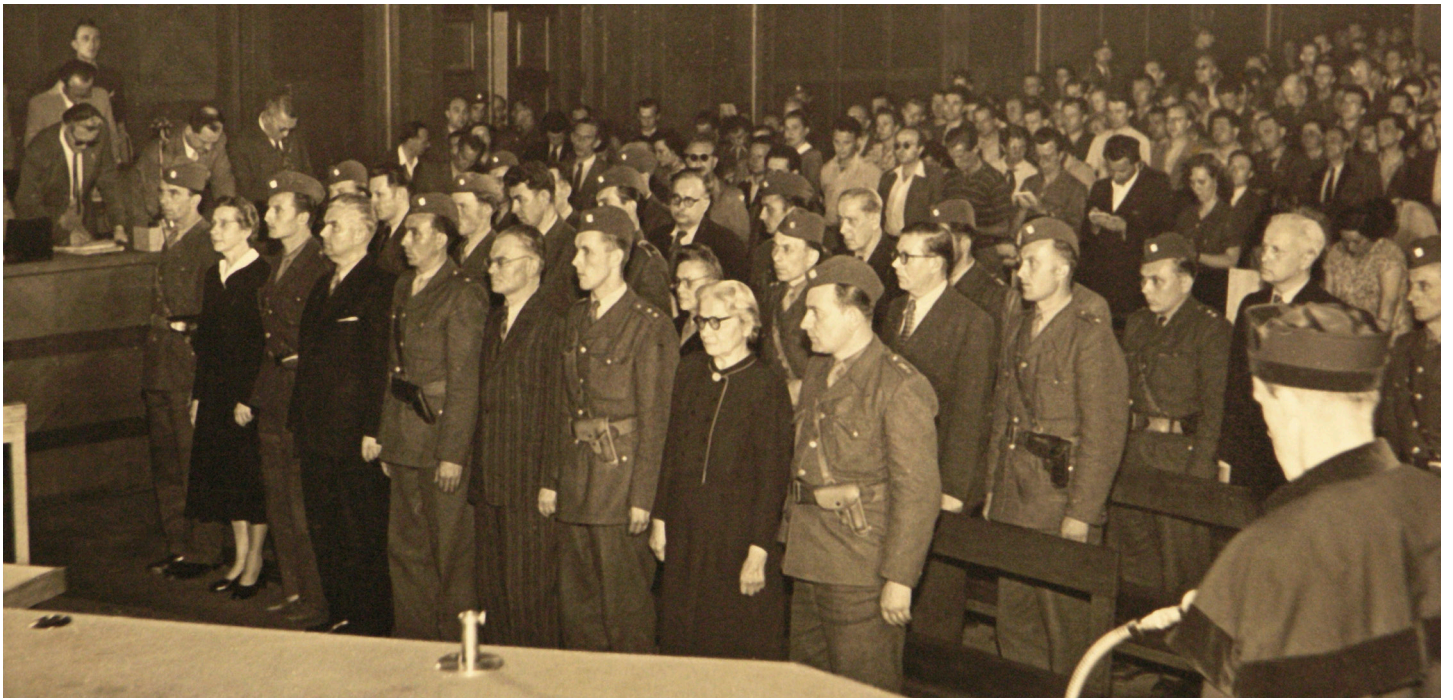
Fotografie z vnesení rozsudku v procesu s Miladou Horákovou a spol. ze dne 8. června 1950 před Státním soudem v Praze