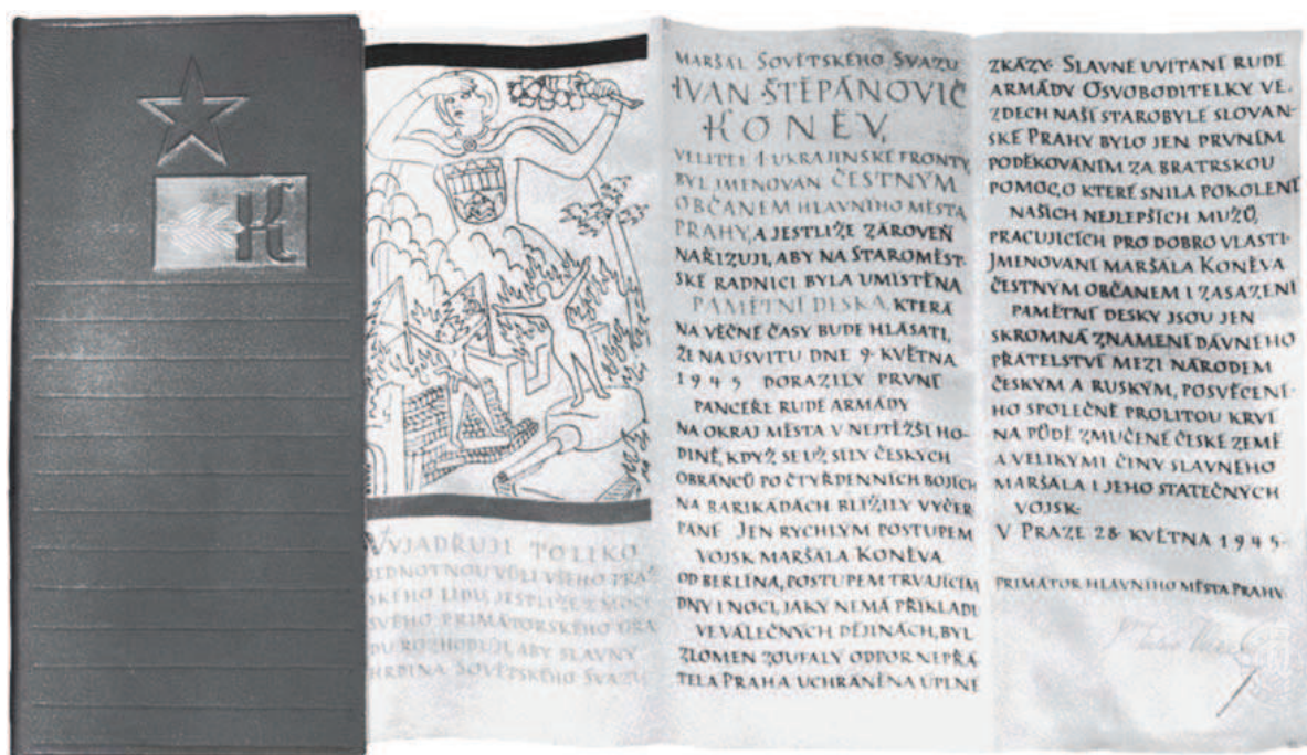
Diplom čestného občanství města Prahy maršálu Koněvovi, 28. května 1945

Rada Národního výboru hl. m. Prahy vzala 19. července 1977 výsledky soutěže na vědomí a pověřila Galerii hl. m. Prahy realizací sochařské části. Celý pomník měl postavit podnik Výstavba hlavního města Prahy. Po komplikovaném jednání s autorem návrhu, který neúspěšně požadoval oddálení termínu, byla podepsána smlouva na celkovou částku 385 000 Kčs. 8