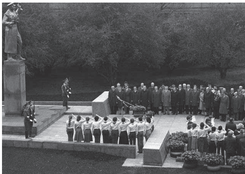
Odhalení Koněvova pomníku 9. května 1980