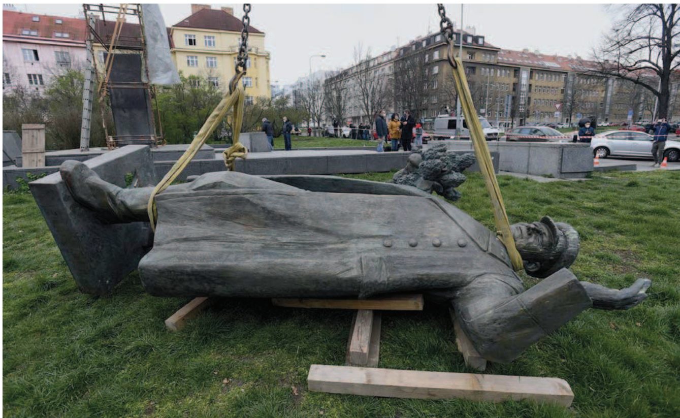
Koněvova socha s vysvětlujícími tabulkami v roce 2018

potlačení maďarské revoluce v roce 1956 či srpnovou okupaci Československa. Autoři těchto nápisů však nebyli zjištěni; nabízí se tedy otázka, zda se nejednalo o záměrnou provokaci.