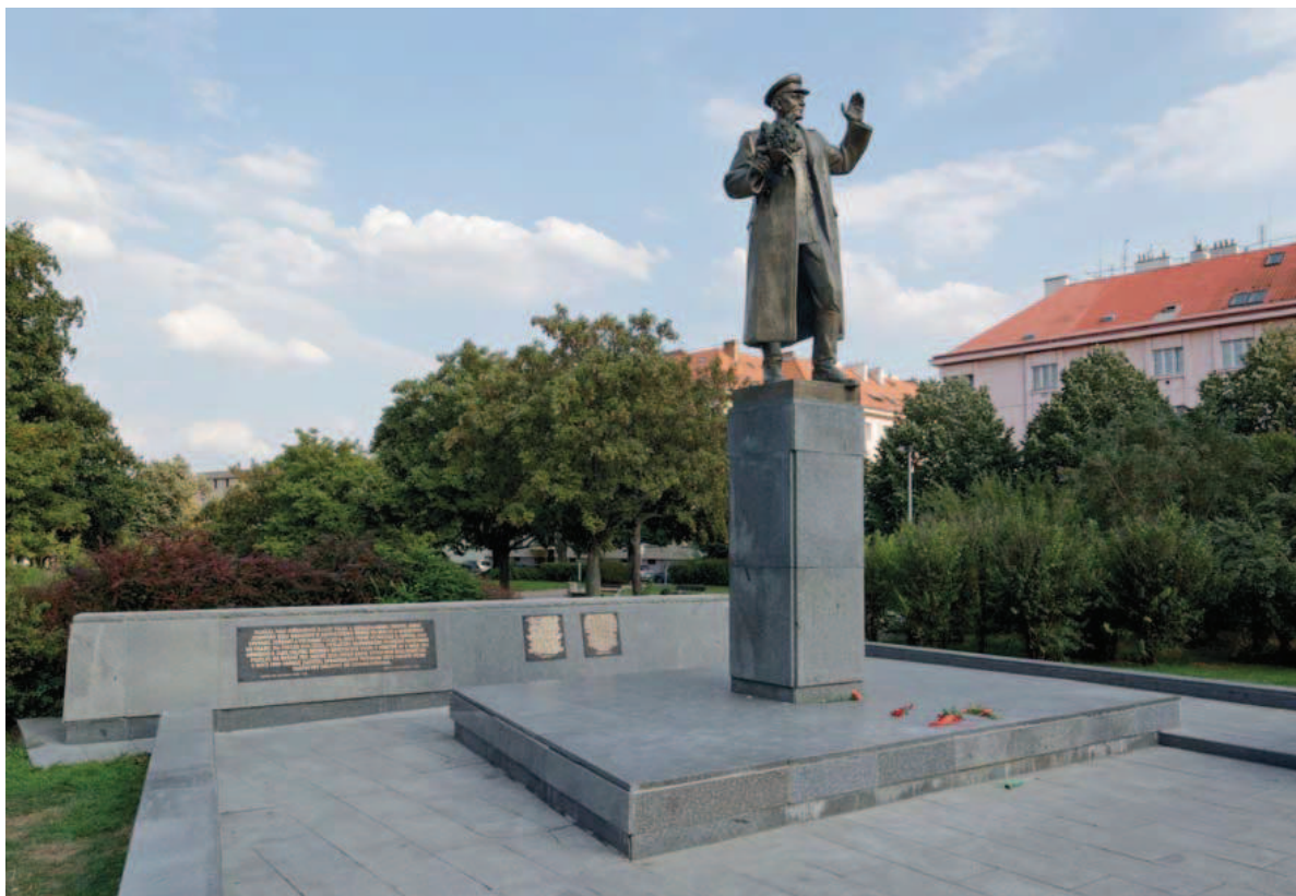
Koněvova socha s vysvětlujícími tabulkami v roce 2018

Na rozdíl od jiných pomníků z komunistického období Koněvova socha přežila vlnu jejich odstraňování po roce 1989, která také zasáhla Leninovu sochu na nedalekém Vítězném náměstí (v letech 1952—1990 neslo název náměstí Říjnové revoluce). V dokumentaci k pomníku je bez bližších podrobností uvedeno, že o odstranění pomníku usilovalo jedno z místních sdružení Občanského fóra. 27 Jedním z důvodů neúspěchu zmíněného návrhu byla patrně přítomnost Sovětské armády na československém území až do června 1991 a vliv předchozí oficiální interpretace událostí spojených s Pražským povstáním a koncem druhé světové války.