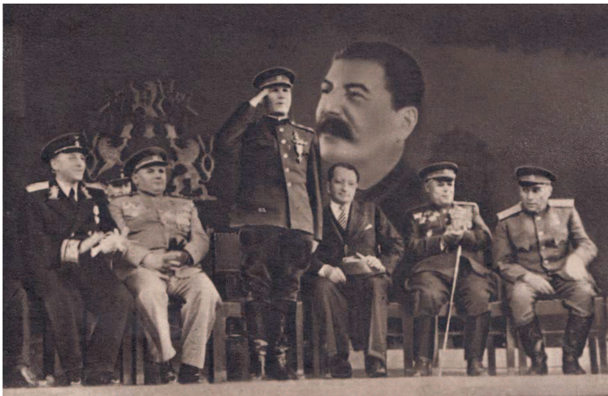
Maršál Koněv na slavnostním shromáždění na Staroměstském náměstí 6. června 1945