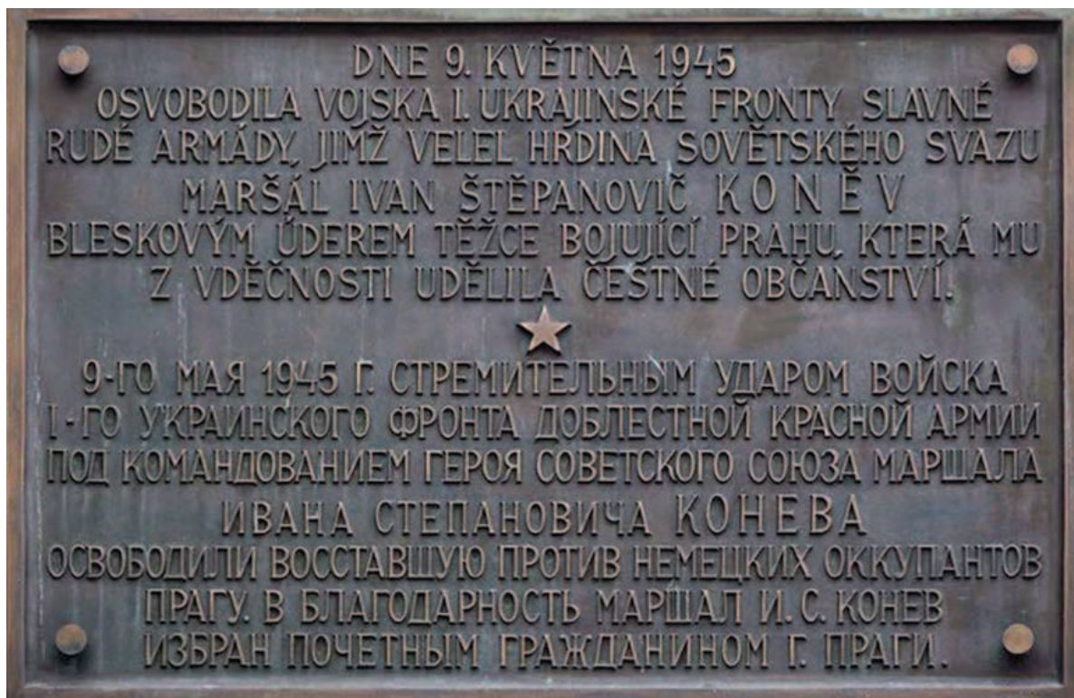
Pamětní deska maršála Koněva byla na Staroměstské radnici umístěna v letech 1946—2017