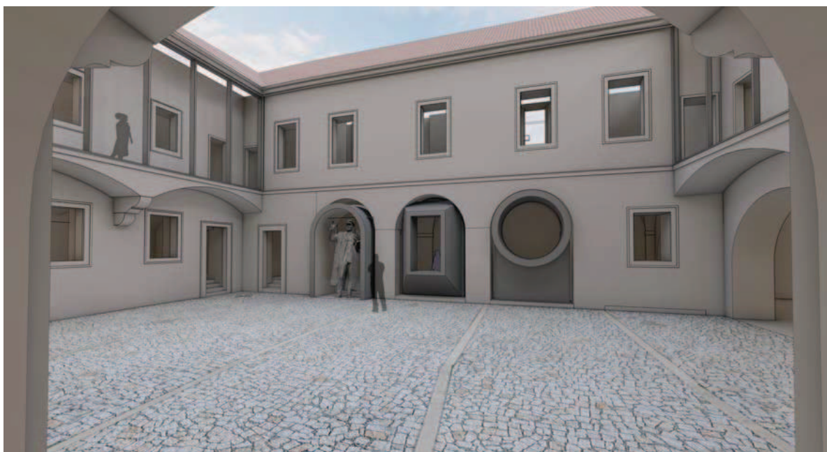
Návrh umístění sochy I. S. Koněva v Domě pážat vytvořil v roce 2020 architekt Tomáš Hradečný (Wiki-media Commons)

Pomník nikdy nebyl zapsán v Centrální evidenci válečných hrobů, spravované Ministerstvem obrany České republiky podle zákona č. 122/2004 Sb., o válečných hrobech a pietních místech. 31 Stoupenci setrvání Koněvova pomníku na náměstí Interbrigády se přesto pokusili jeho přesun zastavit tím, že požádali o jeho prohlášení za nemovitou kulturní památku. Národní památkový ústav tyto žádosti v listopadu 2019 odmítl s odkazem na postoj příslušné komise, podle níž se jedná o nedostatečně kvalitní umělecké dílo. 32