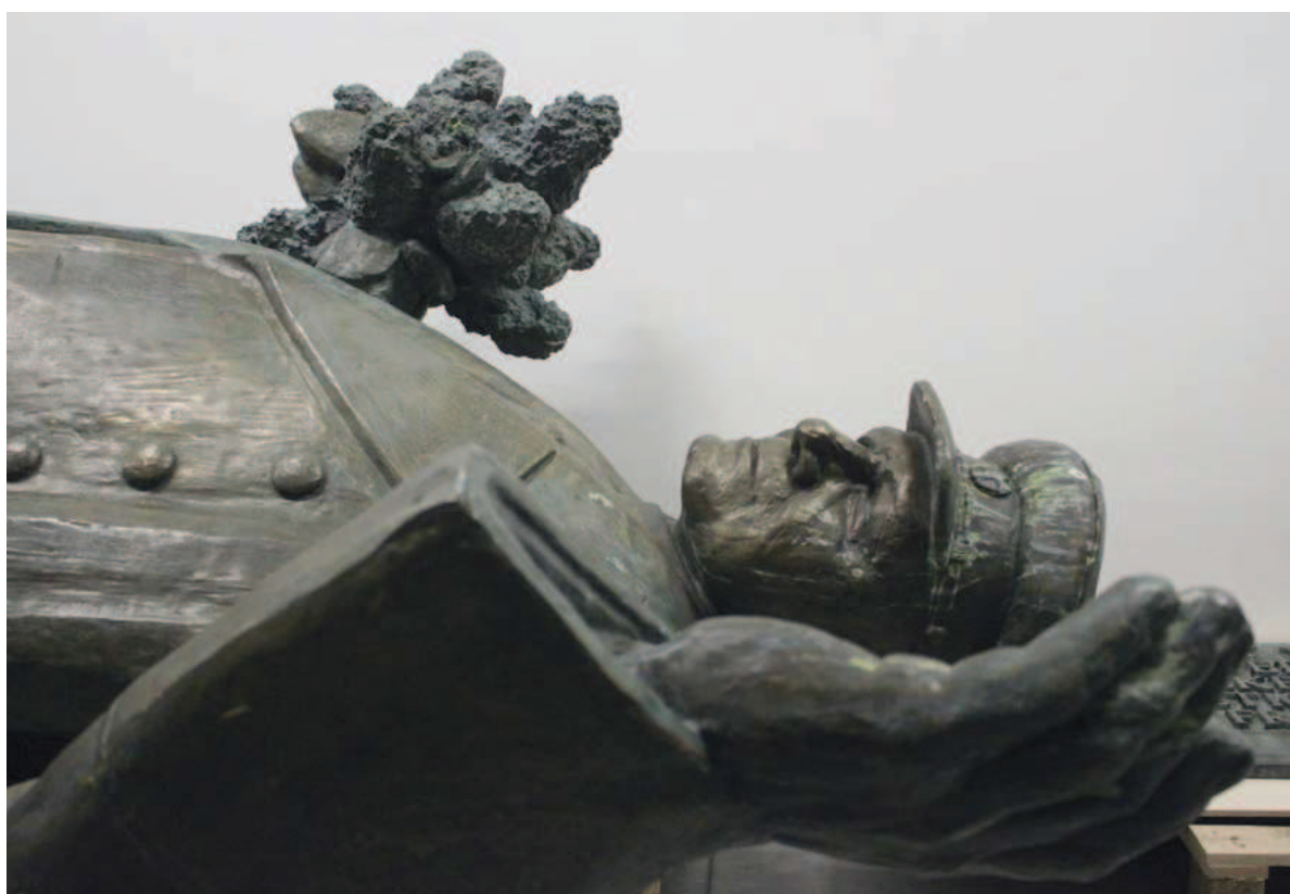
Koněvova socha uložená ve skladu uměleckých předmětů v roce 2020