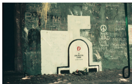
Zeď v roce 1983

Napsal jste na zeď také nějaké své poselství? Který z původních nápisů vás nejvíce zaujal?