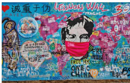
Zeď v roce 2020